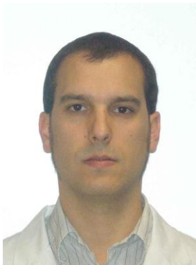
Jefe de Sección (Jefe de Servicio en funciones)